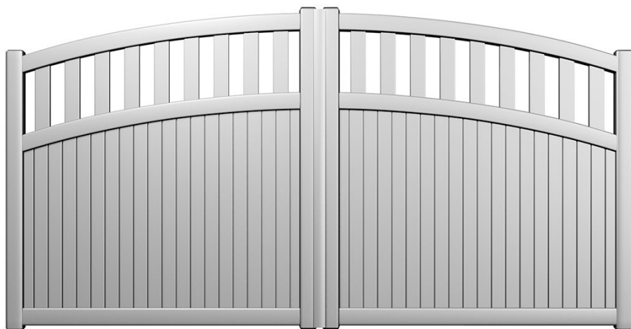
Modèle présenté : Gamme Séduction - Style classique