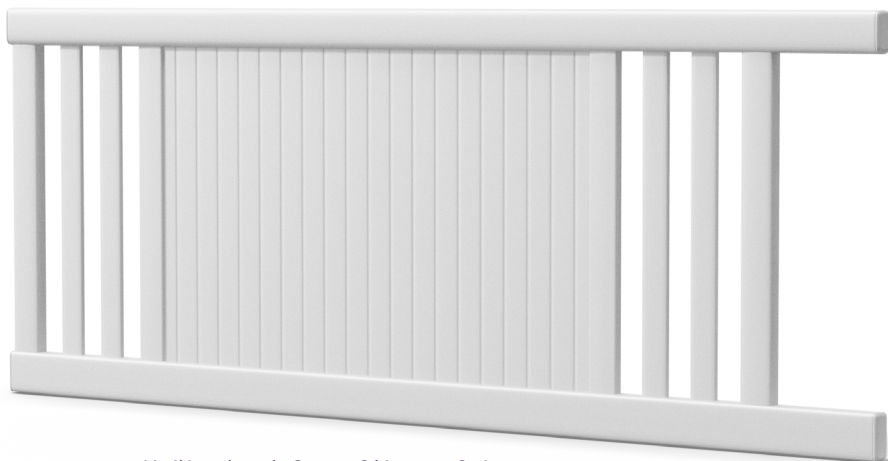
Modèle présenté : Gamme Séduction - Style contemporain