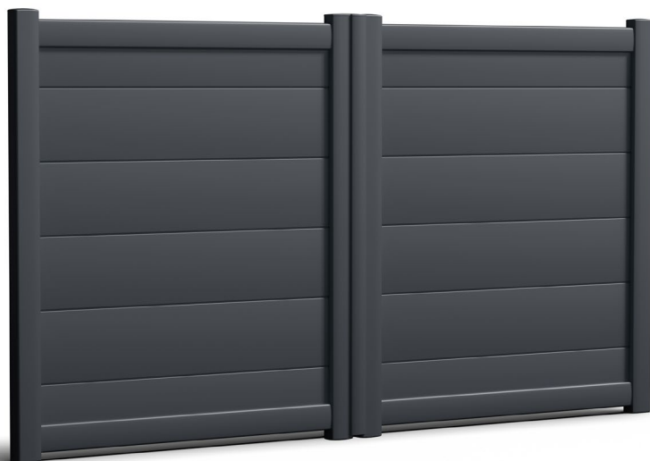
Modèle présenté : Gamme Séduction - Style contemporain - Vision pleine horizontale