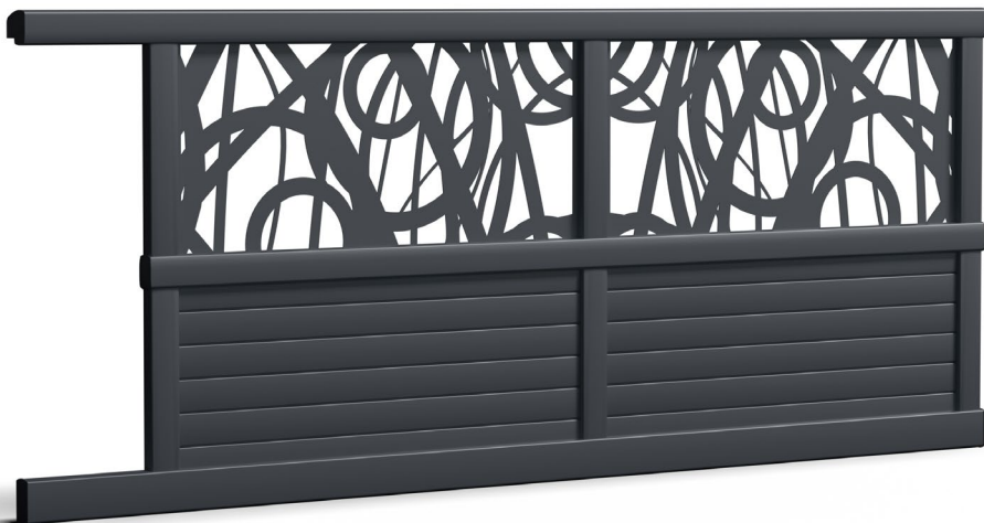
Modèle présenté : Gamme Séduction - Style décoratif